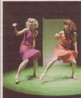
Verdichtete Erfahrung: «Les amuse bouches» in Luzern.