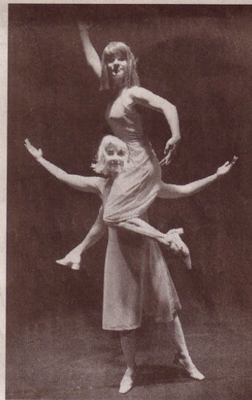
Lustig, frisch und tanzbar: Les Amuse Bouches geben am Samstag ein Gastspiel im fabriggli.

In der Erarbeitung der Stücke sind Recherchen und Improvisationen die Grundlage. Über sie wird die «Bewegungssprache» der jeweiligen Produktionen herausgearbeitet. Die Mitwirkenden sind äusserst unterschiedliche Menschen, die eine starke innere Verbindung und Präsenz haben. Sie besitzen die Fähigkeit, sich tänzerisch sowie theatral zu äussern. (pd)