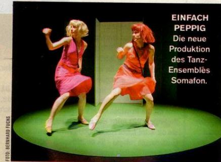
EINFACH PEPPIG Die neue Produktion des Tanz-Ensembles Somafon.

KLEINTHEATER Luzern, 1. bis 4. 2. Tickets Tel. 041 - 210 33 50, www.kleintheater.ch ; BÜHNE S Zürich, 8. bis 11. 2. Tickets Tel. 077 - 208 43 75, www.buehne-s.ch